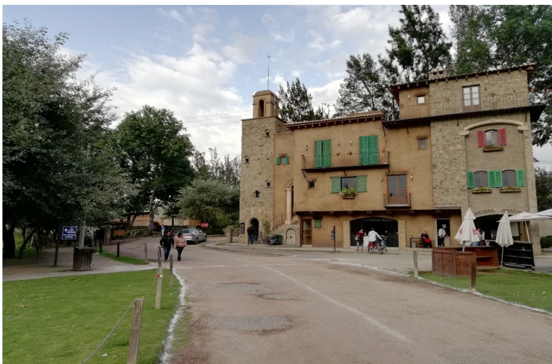
Figura 2. Edificio tradicional toscano en Val'Quirico.

En este punto, los autores nos proponemos describir e interpretar los principales elementos a través de los cuales reconocer Val'Quirico simultáneamente como gated community , open-air shopping mall y enclave artificialmente turistizado. En última instancia, tal caracterización pretende articular un constructo teórico que permita un análisis riguroso del fenómeno: la comunidad-consumo o consumidad .