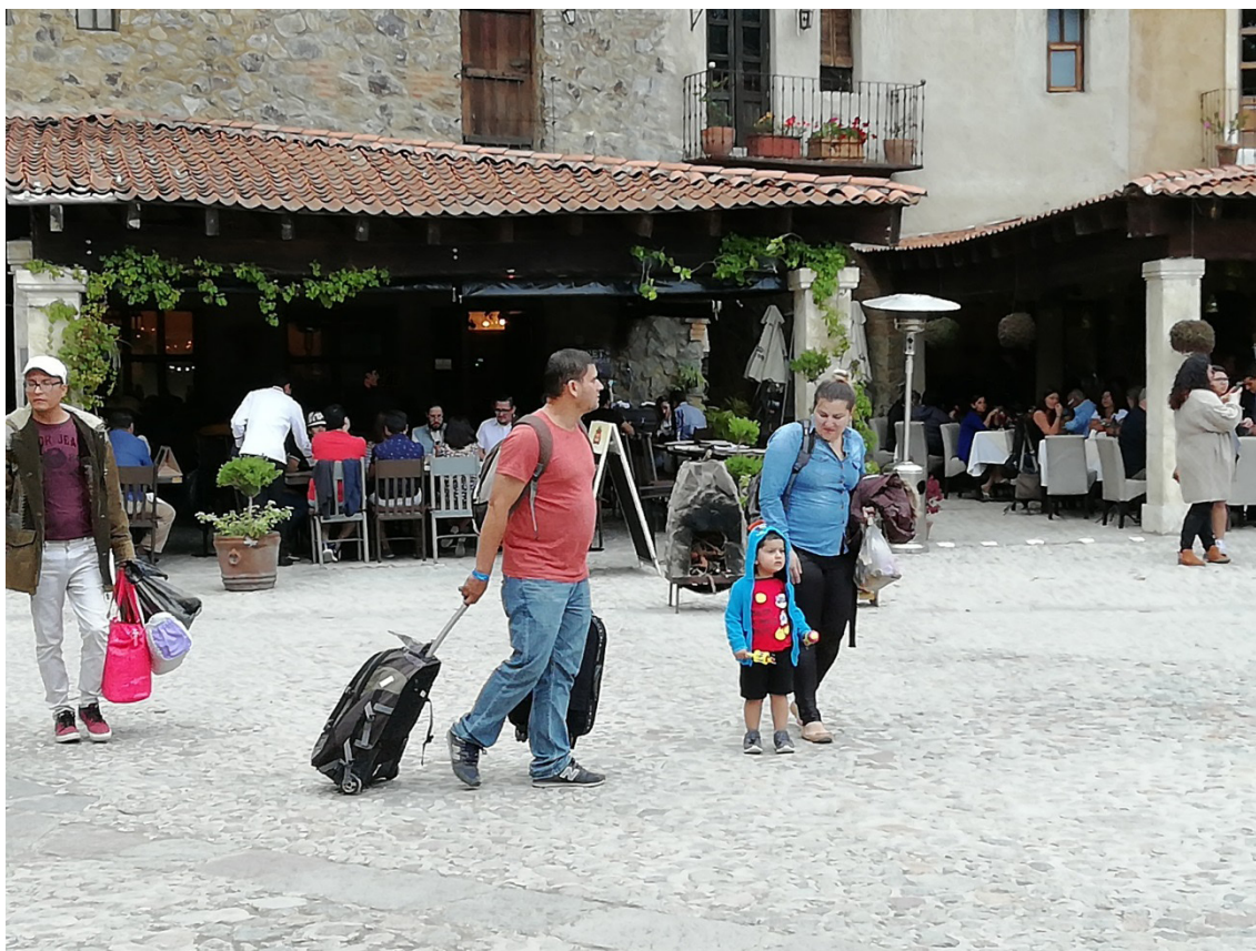
Figura 4. Turistas llegando a Val’Quirico.

del Grupo aBanza destinado a los posibles clientes inmobiliarios apunta a la autenticidad híbrida 48 : “el estilo arquitectónico de Val’Quirico, inspirado en la campaña europea, se conjunta con el encanto de los pueblos tradicionales mexicanos para crear un espacio con una magia singular: un rincón medieval en pleno corazón de México”.