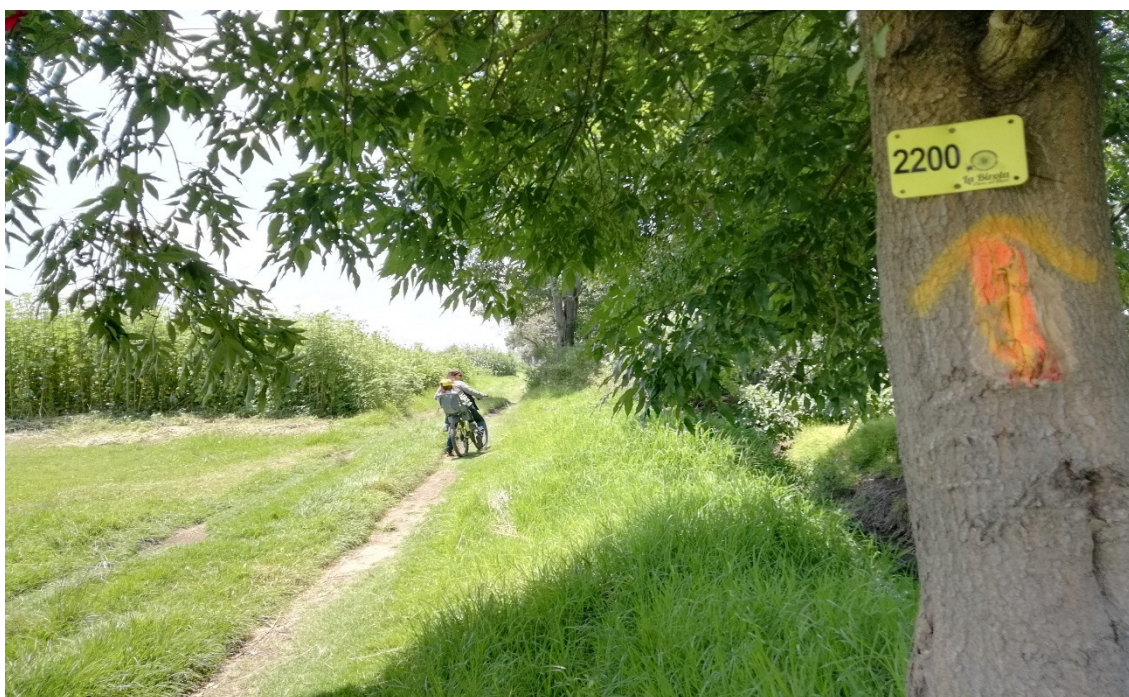
Figura 3. Indicadores extramuros para los cicloturistas de Val'Quirico.

En definitiva, si retomamos, esta vez desde otro punto de vista, el análisis de la caracterización de Val'Quirico como residencial cerrado con un centro comercial en su interior, encontramos que en los límites del enclave no existe ningún establecimiento comercial comúnmente conocido como tradicional , es decir, que atienda a las necesidades básicas de alimentación, vestimenta, educación y salud de los posibles vecinos. En otras palabras, todos los establecimientos comerciales ubicados en los límites del complejo pueden ser catalogados como de “alto impacto”, esto es, que por sus características pueden provocar “transformaciones, alteraciones o modificaciones en la armonía de la comunidad”, entre otros, restaurantes, establecimientos de hospedaje y locales para la venta y/o distribución de bebida alcohólicas 37 .